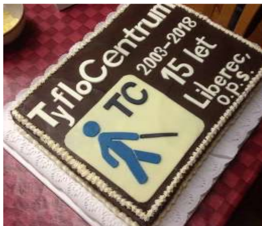
Dort k oslavám 15. výročí založení TyfloCentra