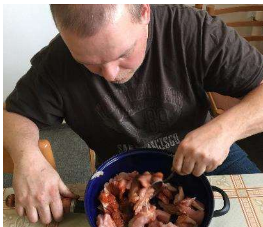
Nácvik sebeobsluhy - vaření