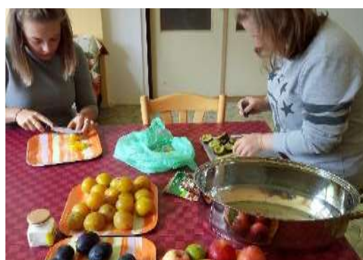
Nácvik sebeobsluhy - výroba pečených čajů