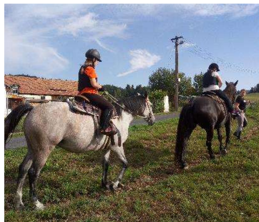
Udržujeme koordinaci jízdou na koni

Služba byla finančně podpořena Krajským úřadem Libereckého kraje, MPSV, Úřadem práce Liberec a Oborovou zdravotní pojišťovnou.