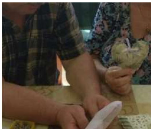
tréning jemné motoriky a výroba šitých polštářků - Česká Lípa