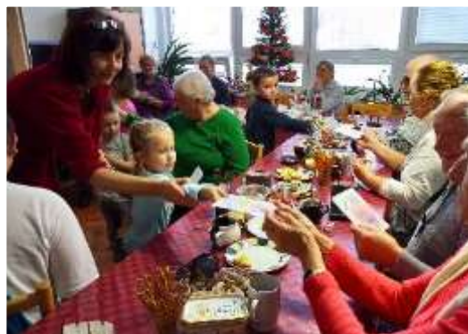
Vánoční vystoupení dětí z blízké MŠ