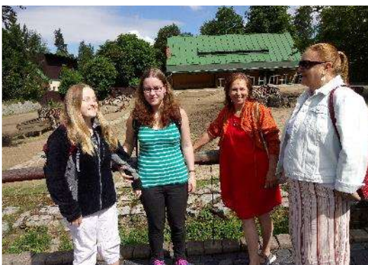
Návštěva ZOO Liberec