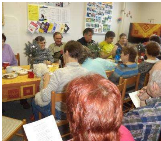
Vánoční setkání v Semilech