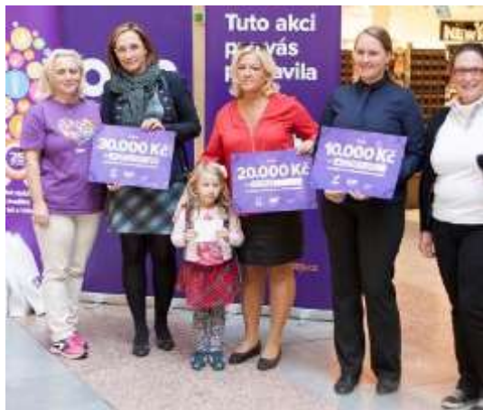
Vyhlášení soutěže Každý krok pomáhá