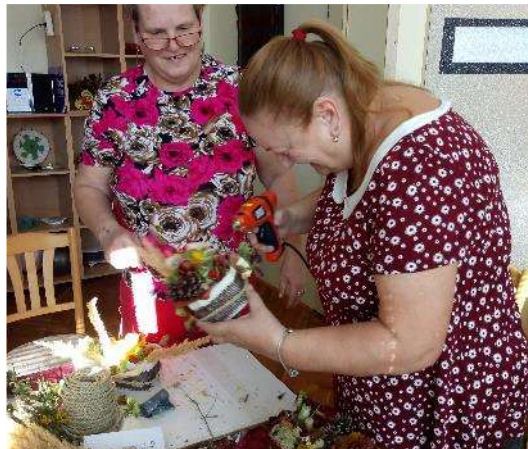
Tréning jemné motoriky - podzimní dekorace