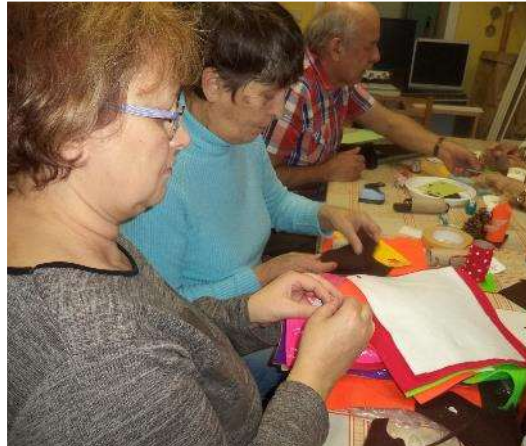
Nácvik každodenních činností - šijeme pro radost

Veškeré akce a aktivity byly klientům zcela volně přístupné, stačilo pouze předem projevit zájem a dodržovat pravidla, která platila pro realizaci těchto akcí. Byly rovněž vhodně uzpůsobené sníženému nebo chybějícímu zrakovému vnímání.