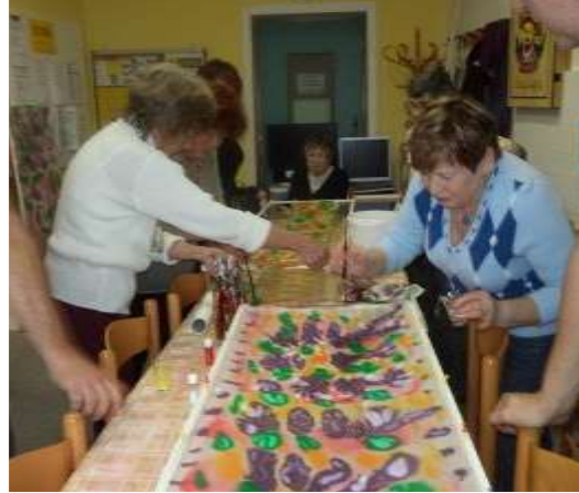
Malování na hedvábné šátky aneb trénujeme manuální zručnost