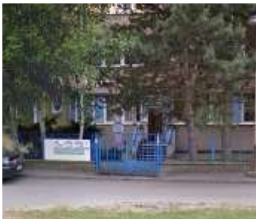
Pobočka Česká Lípa