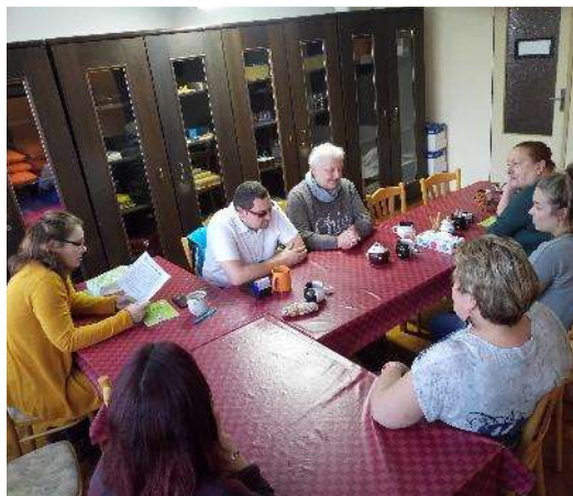
Čtení z knihy Rozverná pětka Romana Vaňka

Sociálně aktivizační služby zahrnovaly širokou nabídku nejrůznějších akcí a aktivit, ať již ambulantních či terénních. Jejich cílem bylo zamezení sociálnímu vyloučení a izolaci osob, které se ocitly v závažné životní situaci po získání těžkého zrakového postižení, a v důsledku čehož mají sníženou schopnost pohybu a orientace, přístupu k informacím a poznávání světa. Tyto služby vycházely z individuálních potřeb a schopností uživatelů a pozitivně ovlivňovaly fyzické a psychické fungování uživatelů.