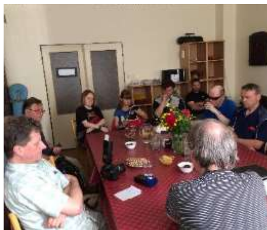
Úvod k akci Po Liberci poslepu