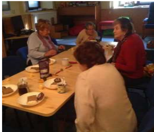
Turnovské posezení při příležitosti 15 let od založení TyfloCentra

Informace o službě byly zveřejněny v Materiálech pro klienty, na webových stránkách organizace a v Registru poskytovatelů sociálních služeb.