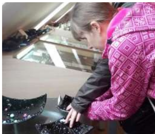
Návštěva sklárny v Heřmanicích

Služba byla finančně podpořena Krajským úřadem Libereckého kraje, MPSV a Úřadem práce Liberec.