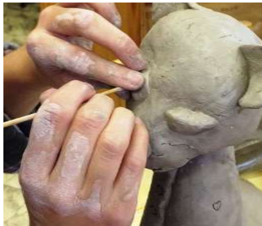
Tvůrčí proces v keramické dílně

Hlavní činností společnosti je poskytování sociálních služeb osobám s těžkým zrakovým postižením – nevidomým a slabozrakým, a osobám s jiným zdravotním, zejména kombinovaným (zrakovým a jiným) postižením. Cílem je vést tyto osoby k integraci do společnosti, k osobnímu rozvoji a větší míře seberealizace. TyfloCentrum Liberec, o.p.s. poskytuje lidem žijícím na území Libereckého kraje tři základní sociální služby – Sociálně