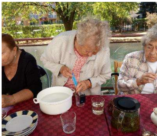
Olympiáda na závěr školního roku - předháníme se ve zručnosti i orientaci

Sociálně aktivizační služby zahrnovaly širokou nabídku nejrůznějších akcí a aktivit, ať již ambulantních či terénních. Jejich cílem bylo zamezení sociálnímu vyloučení a izolaci osob, které se ocitly v závažné životní situaci po získání těžkého zrakového postižení, a v důsledku čehož mají sníženou schopnost pohybu a orientace, přístupu k informacím a poznávání světa. Tyto služby vycházely z individuálních potřeb a schopností uživatelů a pozitivně ovlivňovaly fyzické a psychické fungování uživatelů.