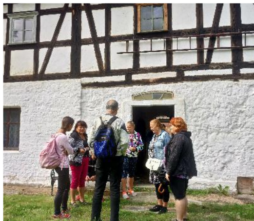
Návštěva muzea v Pertolticích