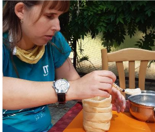
TyfloKavárna a výroba trdelníků