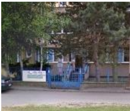
Pobočka Česká Lípa